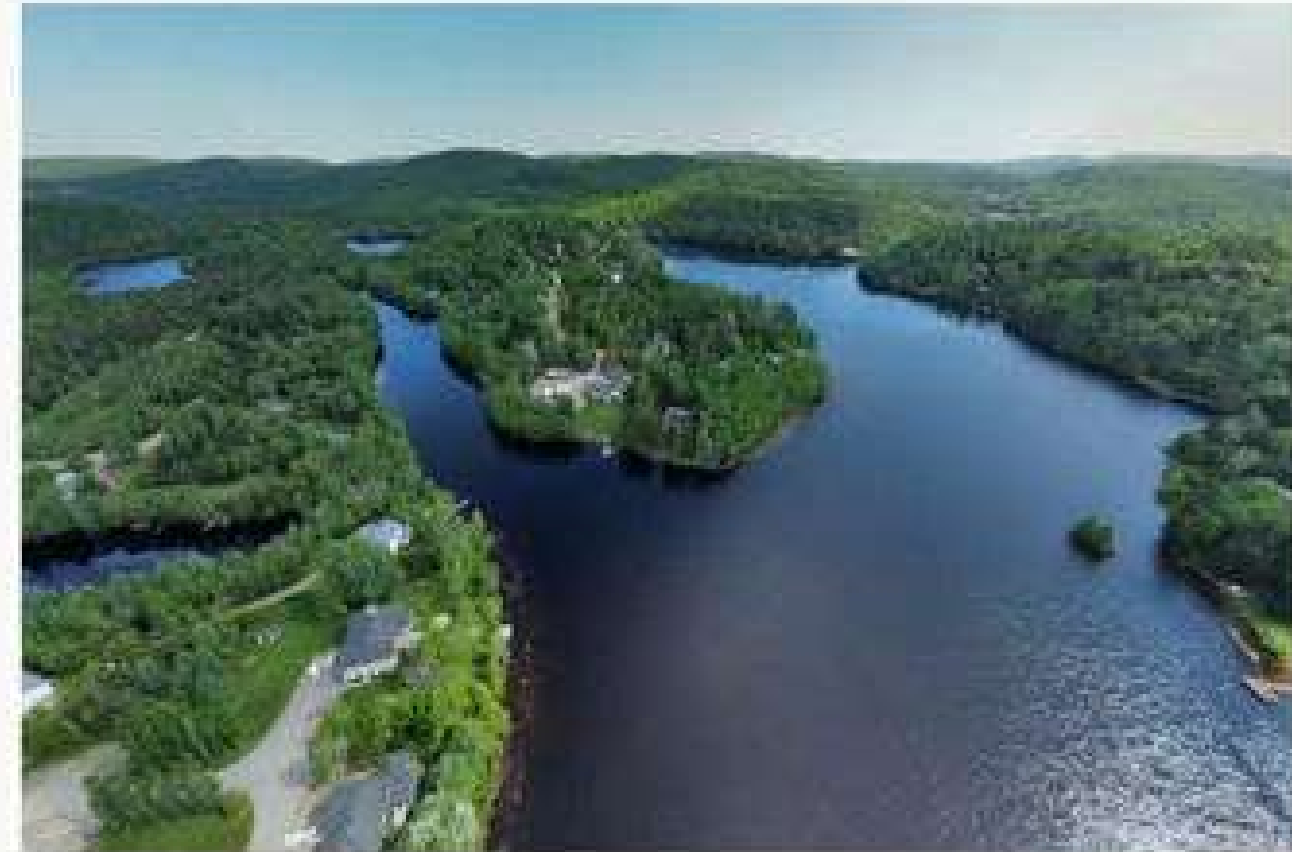
Le lac Côte, dans la région de Lanaudière

(Québec) Dans les prochaines années, des milliers de barrages parsemant le territoire québécois devront être rénovés ou reconstruits, un travail imposant qui coûtera des centaines de millions de dollars. Mais qui doit payer pour ça ? Les riverains, qui bénéficient des lacs créés par ces ouvrages, ou l'ensemble des contribuables, même ceux qui ne peuvent s'y tremper l'orteil en pleine canicule ? Les villes demandent de l'aide.